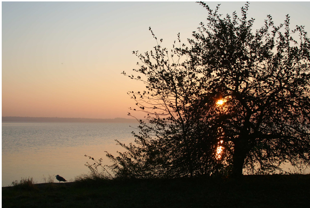
Zachód słońca nad Jeziorem Goczałkowickim