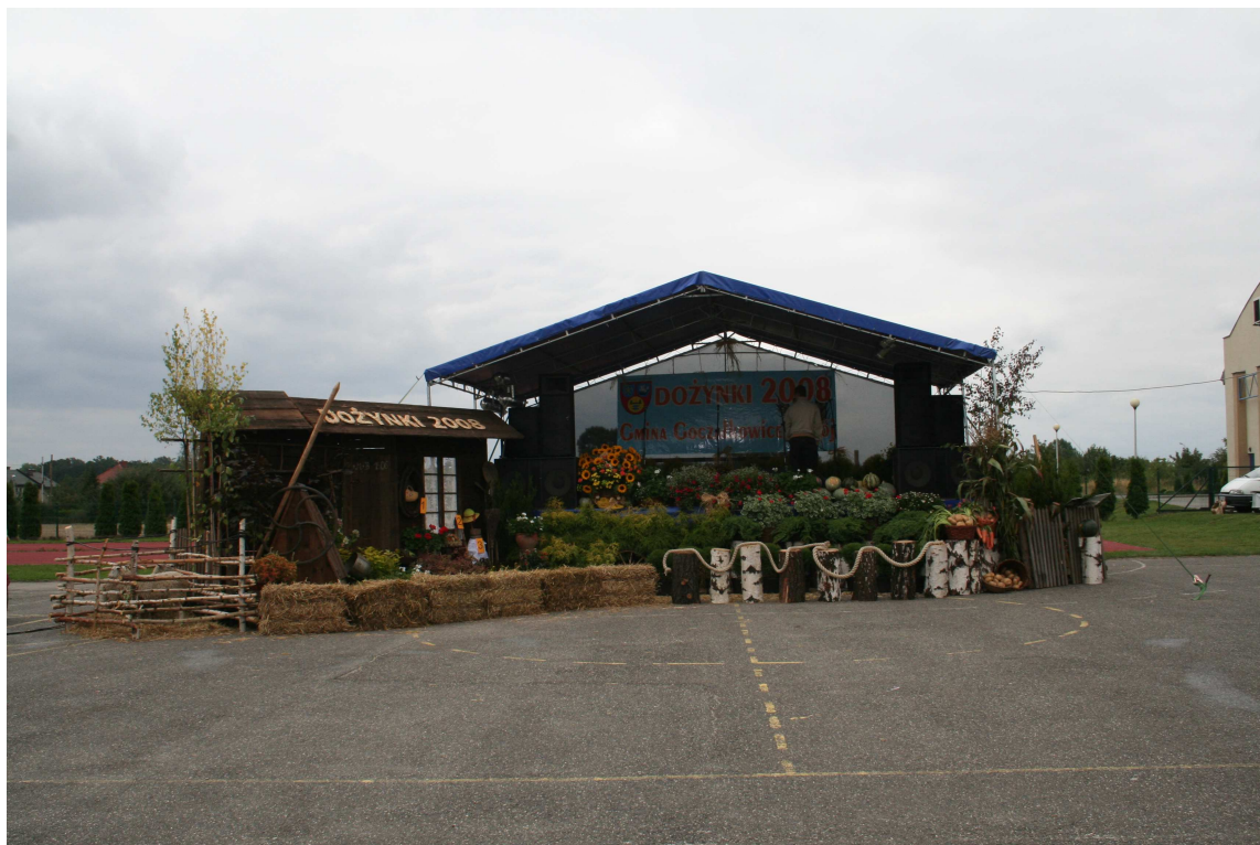
Gminne dożynki 2008

Uświetnia wiele uroczystości, nie tylko kościelnych, prezentuje bogaty repertuar na licznych koncertach, także poza granicami kraju, współpracuje z chórami z Niemiec, Francji oraz Czech