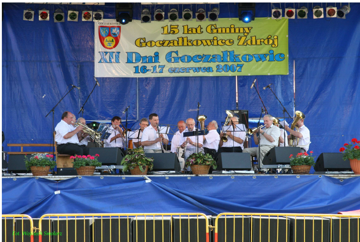
XII Dni Goczałkowice