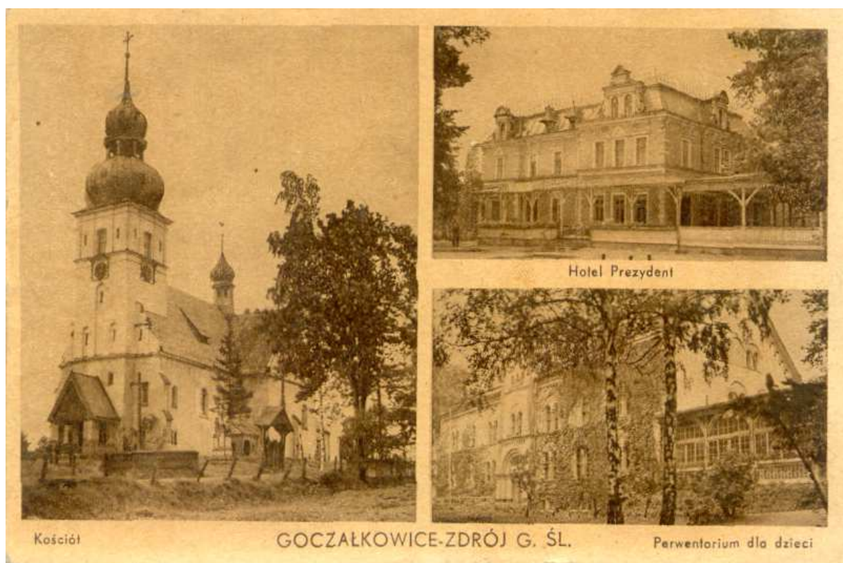
Zdjęcie starej pocztówki

Uzdrowisko szybko zyskiwało na popularności, a liczba kuracjuszy powiększała się wielokrotnie z roku na rok. W 1932 r. nastąpiła zmiana w nazwie wsi na Goczałkowice-Zdrój. Samodzielność gminy kontynuowana od wieków średnich przerwana została w 1975 r., kiedy to włączono ją do Pszczyny. Od 1992 r. znów stała się odrębną jednostką administracyjną.