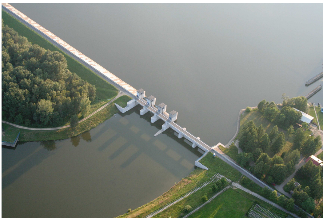
Korona zapory w Goczałkowicach - Zdroju