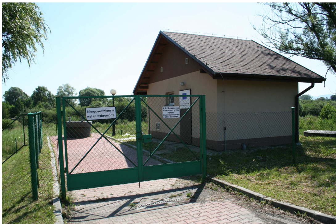
Pompownia na ul. Dębowej