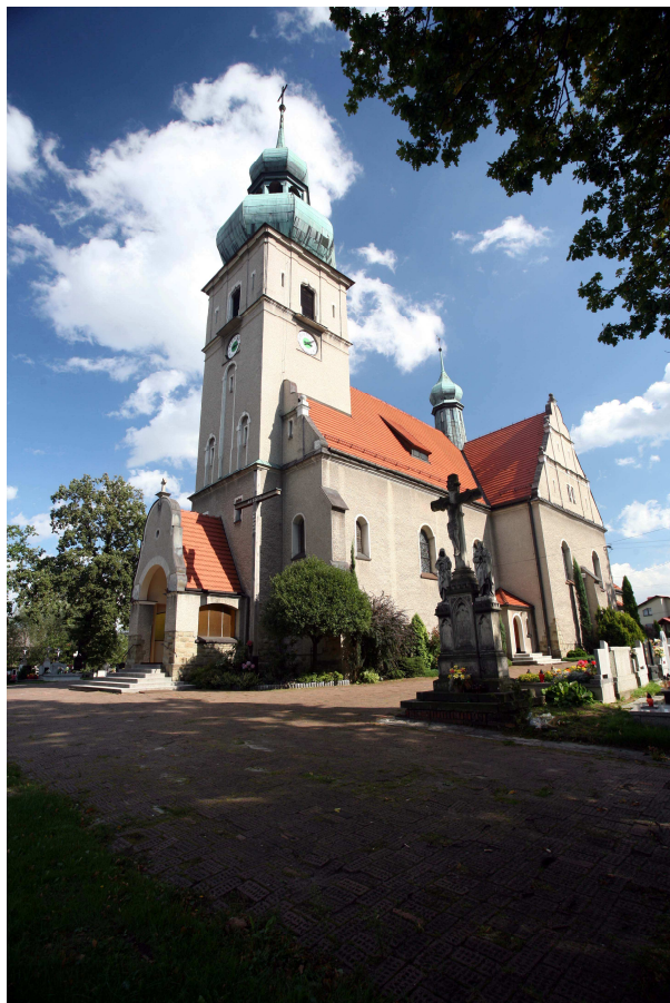
Kościół św. Jerzego