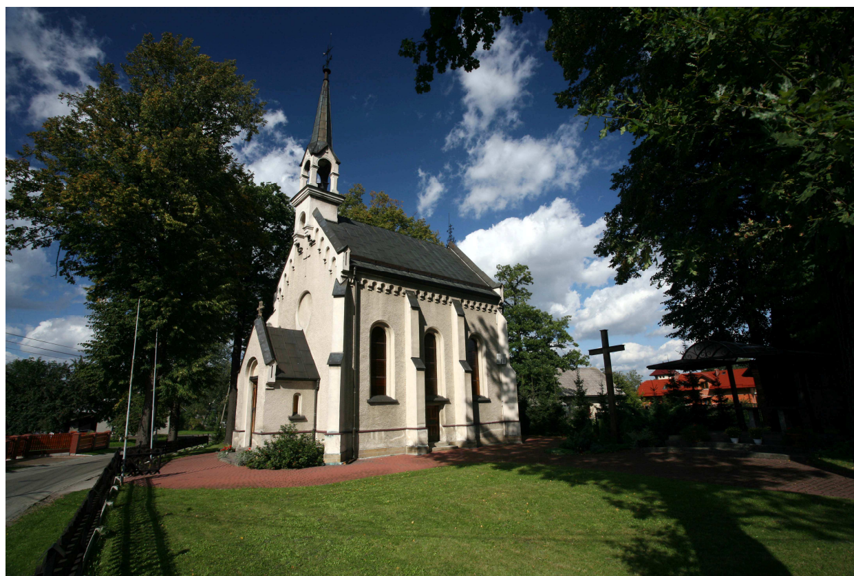
Kościół św. Anny