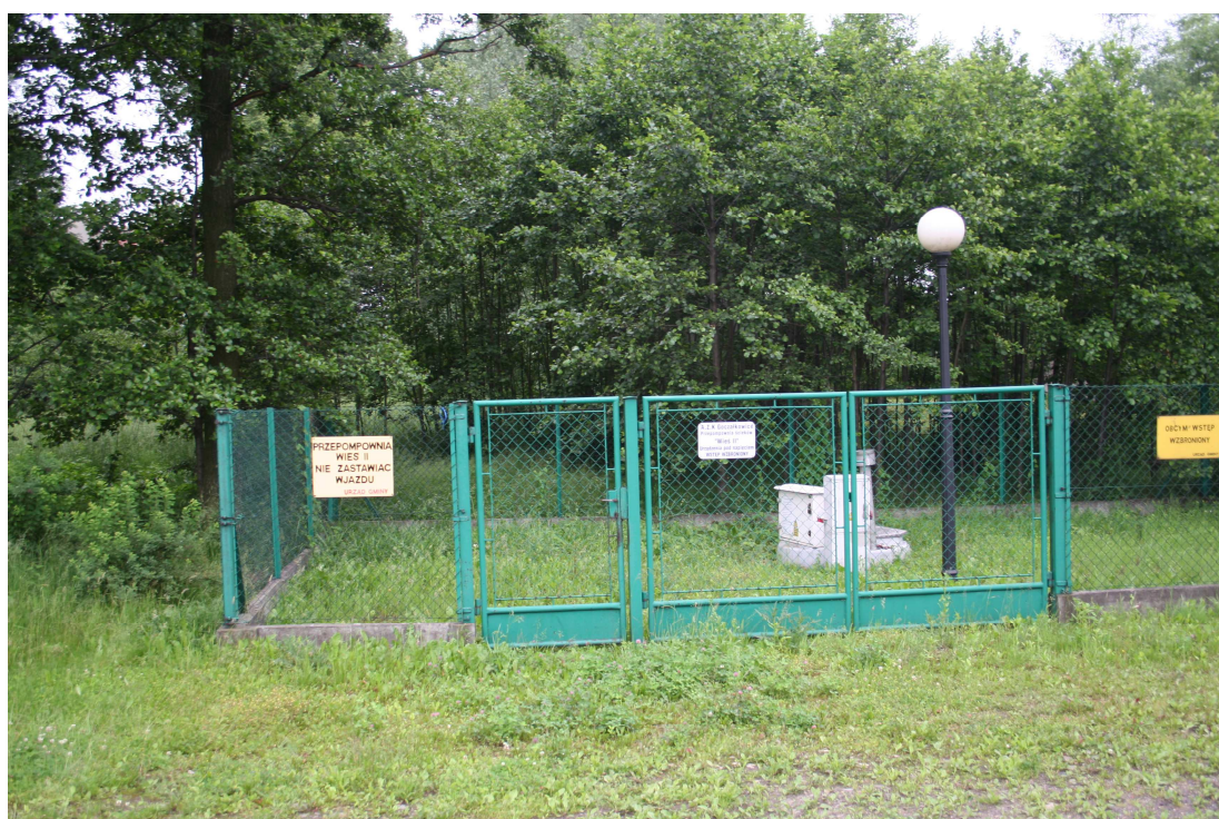
Pompownia na ulicy Głównej