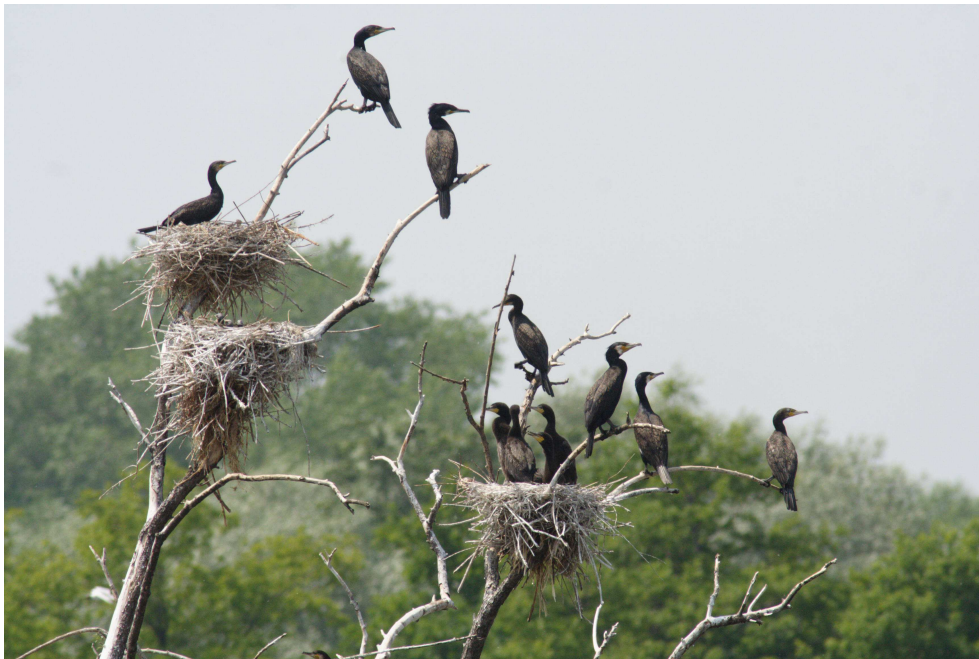
Kormorany nad jeziorem Goczałkowickim

Wymienione powyżej gatunki występują w Dolinie Wisły. Najcenniejszym gatunkiem ssaka na terenie gminy jest bóbr ( Castor fiber ), występujący w dolinie Wisły.